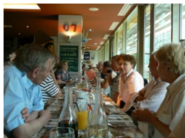
Fin juin : repas à « la Criée »